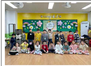
(1학년) 입학 축하해요!