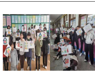
(6학년) 국가 세우기 -개국 선포식