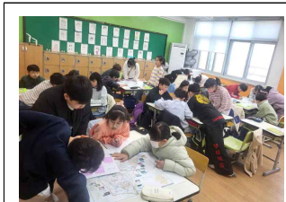
(4학년) 지도로 본 우리 지역