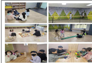
(2학년) 놀이 계획 세워 친구와 놀아요