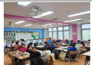
(5학년) 우리나라 지형 만들기