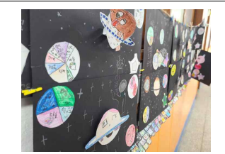
(3학년) 교실 속 우주공간