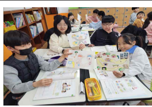
(3학년) 내가 생각하는 우리 교장의 모습