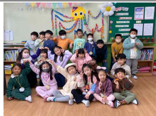
(1학년) 친구들과 함께 협동 문어를 만들었어요.