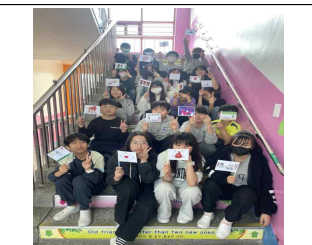
(6학년) 국가 세우기 -개국 선포식