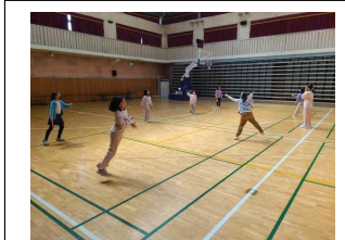
(3학년) 즐거운 패드민턴