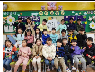
(1학년) 입학 축하합니다~ 함께 하는 우리들