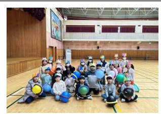
(2학년) 오늘은 나의 날