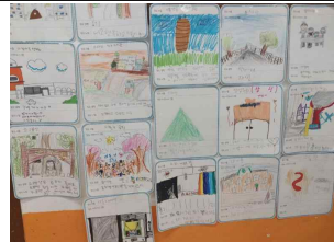
(3학년) 우리교장의 장소 소개