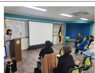
2024 학부모 총회 및 학교교육설명회