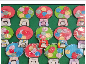
(5학년) 1년 후의 나에게 쓰는 편지(타임캡슐)