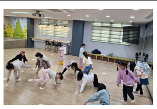
(2학년) <나> 손 따라 발 따라