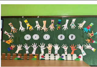
(4학년) 작은 손 큰 꿈