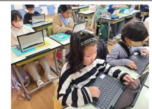
(3학년) 크롬북과의 만남